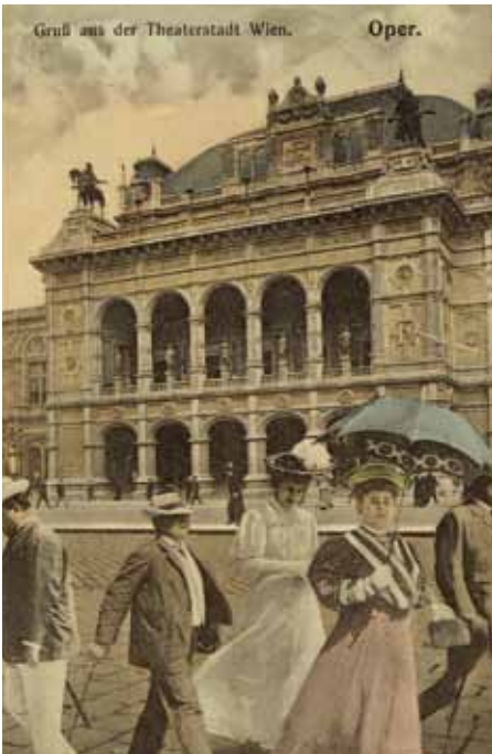
Kolorierte Ansichtskarte vom Hofoperntheater, um 1900

raum verdunkeln ließ. Auch wegen seiner Kompositionen stand er immer im Kreuzfeuer der Kritik.